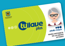
● tullave plus especial

• Te da la facilidad de usar un viaje a crédito en los servicios zonales, (Urbano, Complementario o Especial), validando tu entrada en el torniquete de acceso al vehículo, aun si no tienes carga en tu tarjeta "tullave plus" y ella automáticamente lo descontará de tu saldo en la próxima recarga.