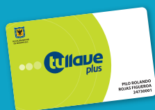
● tullave plus

Recuerda los beneficios de personalizar tu tarjeta: