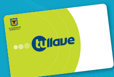
● tullave básica (sin datos personales)

Consulta cómo adquirir, recargar y personalizar las tarjetas en la página: www.tullave.com y en la línea gratuita: 018000 115 510