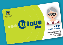
tullave plus especial

• Te da la facilidad de usar un viaje a crédito en los servicios zonales, (Urbano, Complementario o Especial), validando tu entrada en el torniquete de acceso al vehículo, aun si no tienes carga en tu tarjeta "tullave plus" y ella automáticamente lo descontará de tu saldo en la próxima recarga.