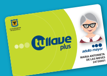
● tullave plus especial

• Te da la facilidad de usar un viaje a crédito en los servicios zonales, (Urbano, Complementario o Especial), validando tu entrada en el torniquete de acceso al vehículo, aun si no tienes carga en tu tarjeta "tullave plus" y ella automáticamente lo descontará de tu saldo en la próxima recarga.