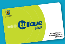
● tullave plus

Recuerda los beneficios de personalizar tu tarjeta: