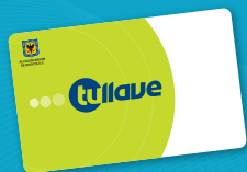
● tullave básica (sin datos personales)

Consulta cómo adquirir, recargar y personalizar las tarjetas en la página: www.tullave.com y en la línea gratuita: 018000 115 510