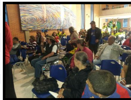
Asistentes al Foro “Tunjuelito Siempre gana con el SITP”

El FORO contó con intérpretes de lenguaje de señas para las personas en condición de discapacidad