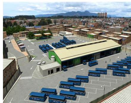
Render Patio La Verbena

Beneficios de la constitución de este patio para Engativá: Mejoras al sector en cuanto a seguridad, aspecto urbanístico y calidad de vida de los habitantes.