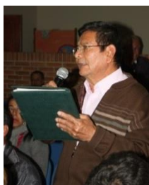
Vocero comunidad Engativá